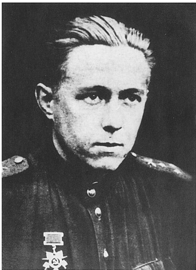
Брянский фронт. 1943