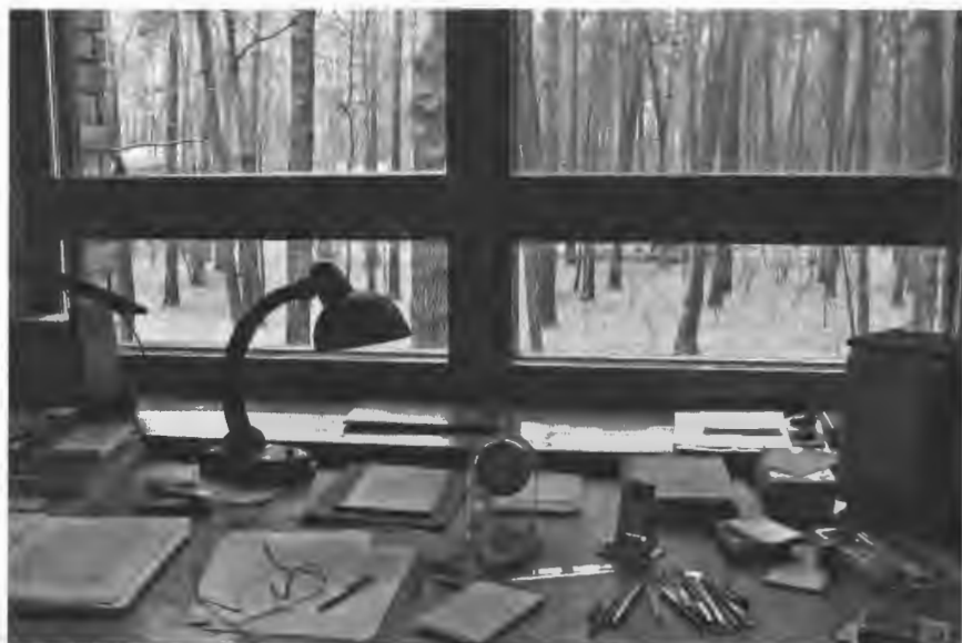
Рабочий стол А.И. Солженицына Троице-Лыково, 2010