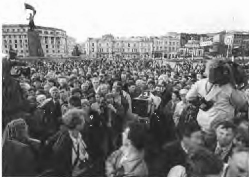
Встреча во Владивостоке. 27 мая 1994