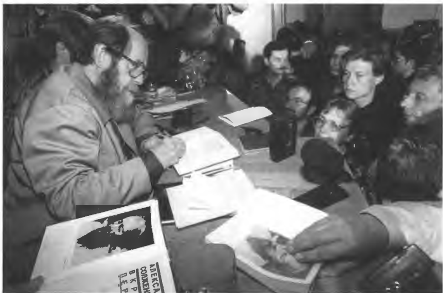
По стране Встреча со студентами. 1994