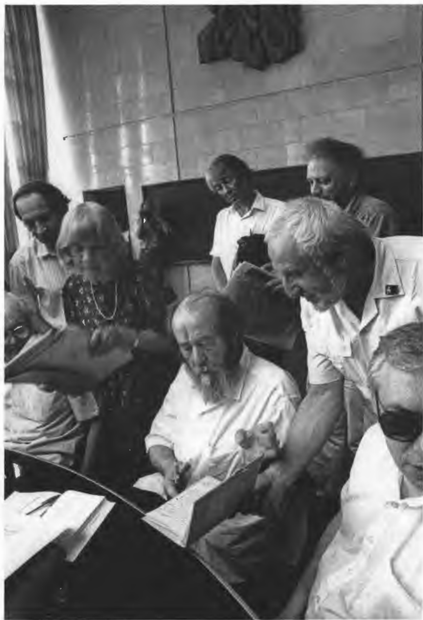
По стране Новосибирск. В Доме ученых Академгородка. 1994