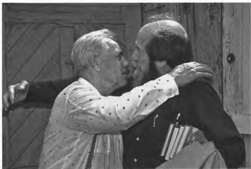
С В. П. Астафьевым Красноярский край, пос. Овсянка. 1994