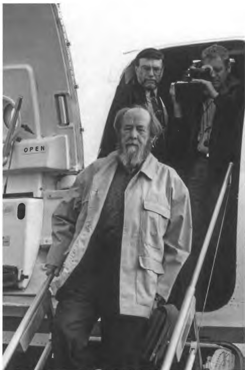
Возвращение А. И. Солженицына на родину Приземление в Магадане. 27 мая 1994