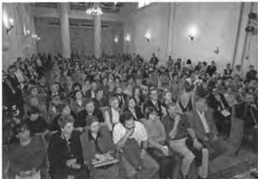
По стране В Петербурге. Встреча в Доме ученых. 1996