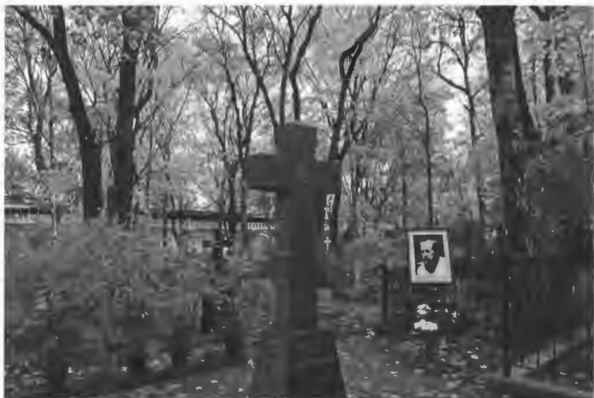
Могила А. И. Солженицына в некрополе Донского монастыря Москва. 2010