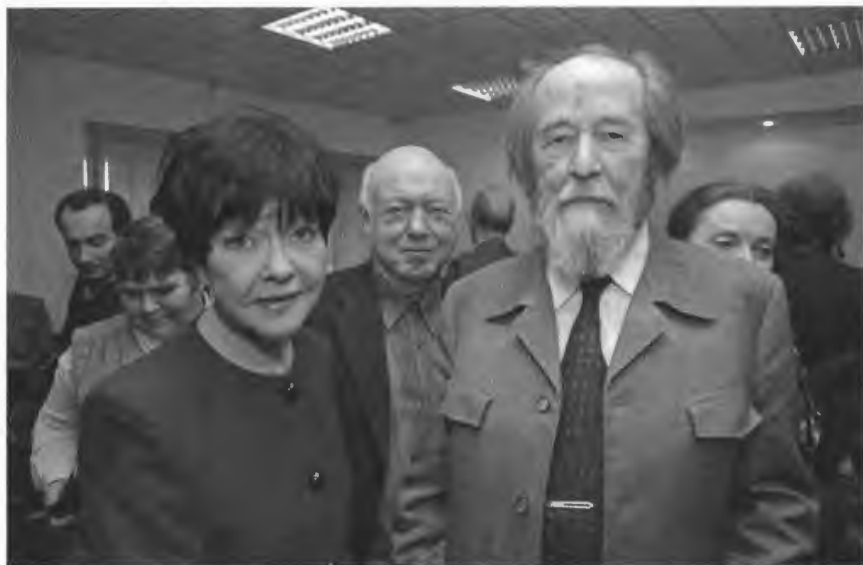
С Беллой Ахмадулиной и Борисом Мессерером Москва. 2000