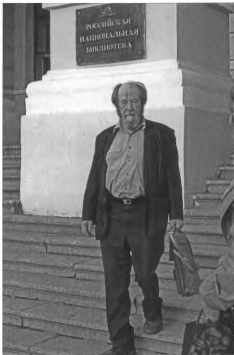
По стране В Петербурге. 1996