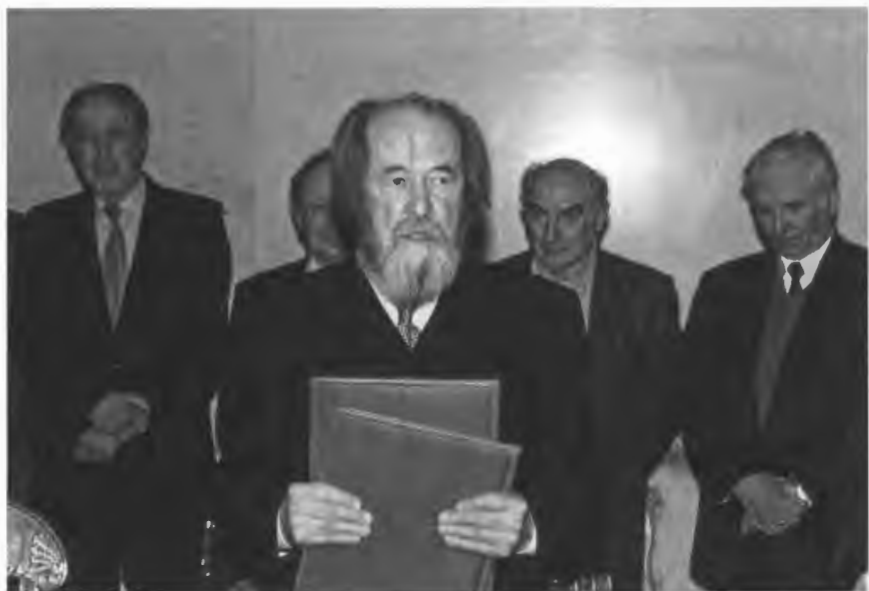
В Российской академии наук Москва. 1998