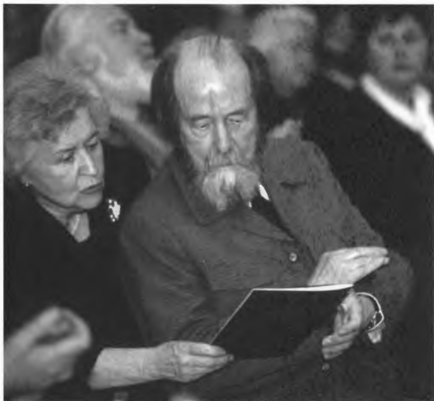
И. А. Антонова и А. И. Солженицын на «Декабрьских вечерах» в Государственном музее изобразительных искусств им. А. С. Пушкина Москва. 1997