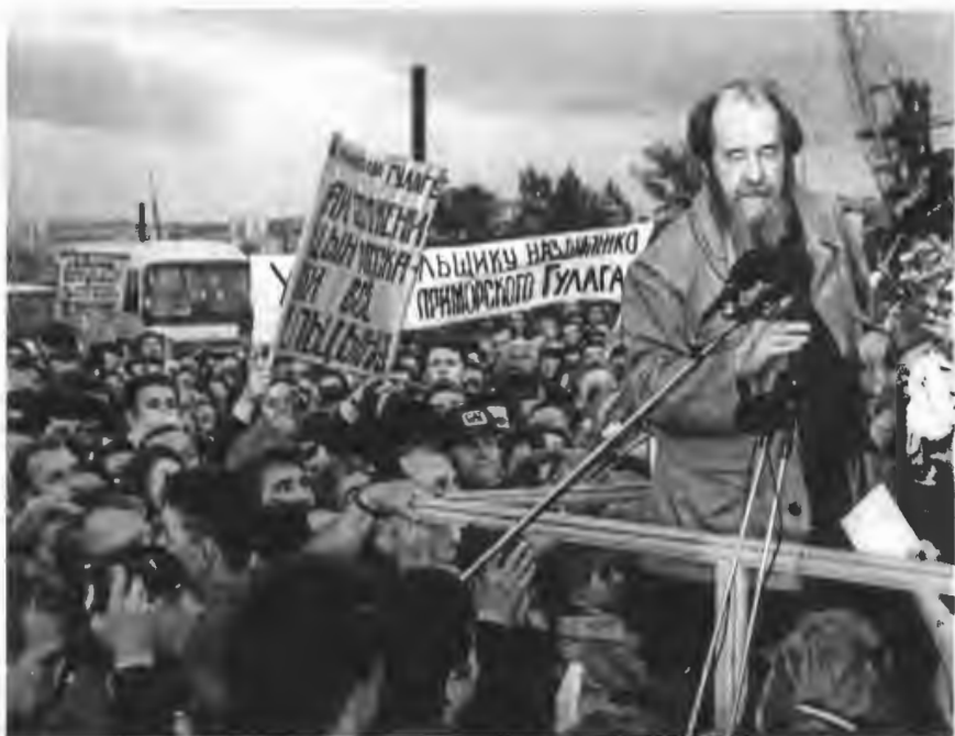
Владивосток. Речь на площади. 27 мая 1994