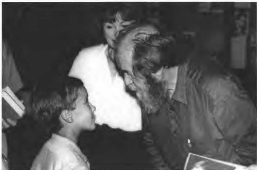
По стране В Омске. 1994