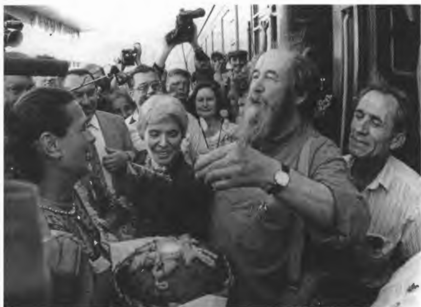
Встреча в Хабаровске. Июнь 1994