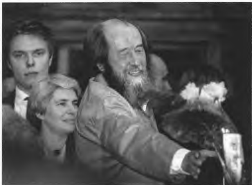
Встреча на Ярославском вокзале в Москве. 21 июля 1994