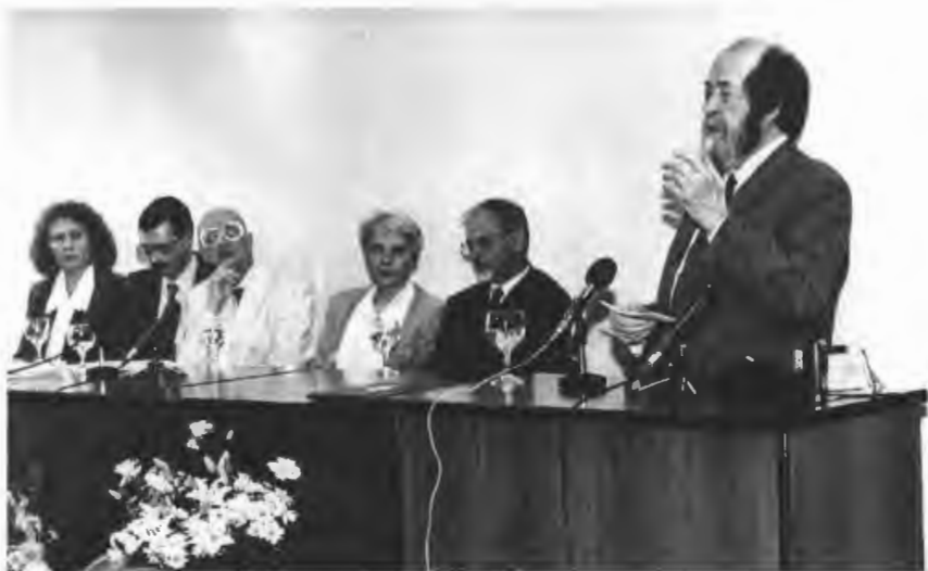
Жюри Литературной премии Александра Солженицына Москва. 1998